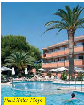
Hotel Xaloc Playa