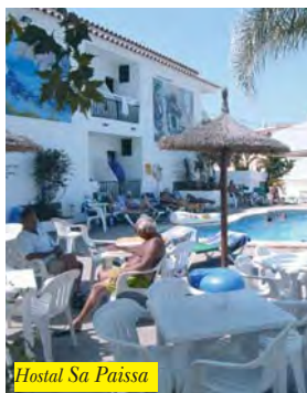
Hostal Sa Paissa