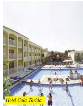
Hotel Cala Tarida