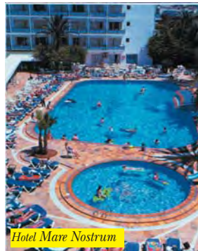
Hotel Mare Nostrum

Situato a Playa d'en Bossa, a circa 100 mt. dalla spiaggia e 3 km dal centro di Ibiza collegato con servizio regolare di autobus. Adatto ad una clientela giovane, dispone di 516 camere dotate di A/C, TV, telefono, cassetta di sicurezza, bagno e terrazza o balcone. Offre reception, piscina, terrazza solarium, bar, ristorante, parcheggio e programmi di animazione.