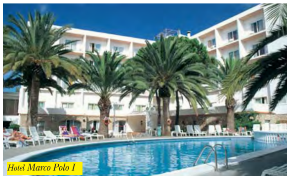
Hotel Marco Polo 1

Si trova a pochi minuti a piedi sia dalla spiaggia che dal centro ricco di negozi, ristoranti, bar e discoteche. Offre 107 camere dotate di bagno con asciugacapelli, TV, A/C e balcone. A disposizione dei clienti reception 24h, cassette di sicurezza, garage, parcheggio, sala giochi, ristorante e bar, piscina, area giochi per bambini.