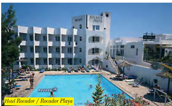
Hotel Rocador / Rocador Playa