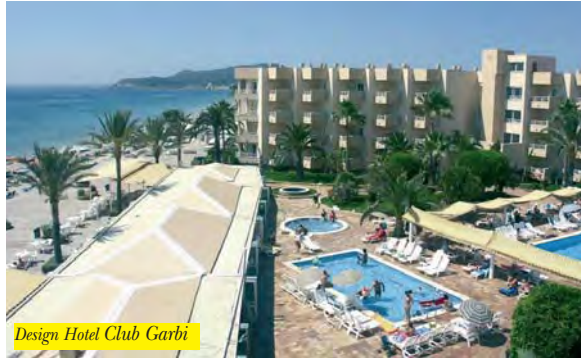
Design Hotel Club Garbi

Il complesso si trova direttamente sulla famosa Playa d'en Bossa, a 5 km dall'aeroporto e 4 km dal centro di Ibiza. Dispone di reception, ristorante, bar, caffetteria, campi da tennis, biliardo, ping-pong, discoteca, sala giochi e piscina. Camere con bagno e balcone.