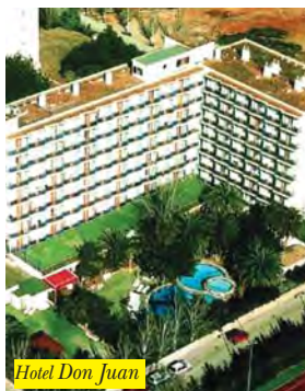
Hotel Don Juan