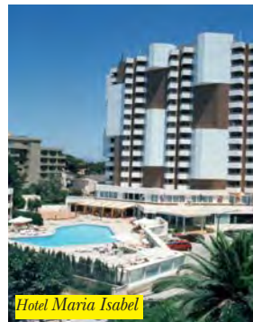
Hotel Maria Isabel

Sorge nel centro dell'area residenziale di Playa de Palma a circa 250 mt dalla spiaggia. A soli 500 mt si trovano le vie dello shopping e a 250 mt la fermata del bus. La struttura offre reception, piscina, sala Tv, bar, connessione Internet, sauna e 132 camere con Tv, climatizzatore, cassetta di sicurezza e balcone o terrazza la maggior parte con vista mare.