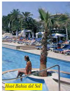
Hotel Bahia del Sol