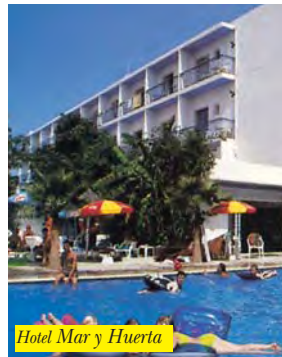
Hotel Mar y Huerta

Si trova a Cala Tarida, sopra una piccola baia con una bella spiaggia sabbiosa da cui dista circa 250 mt, raggiungibile attraverso una scalinata. La città di San Antonio è a 10 km facilmente raggiungibile con mezzi pubblici. Dispone di piscina, ristorante, bar, parcheggio e camere con A/C, telefono e balcone.