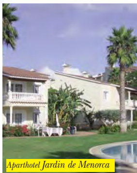
Aparthotel Jardin de Menorca