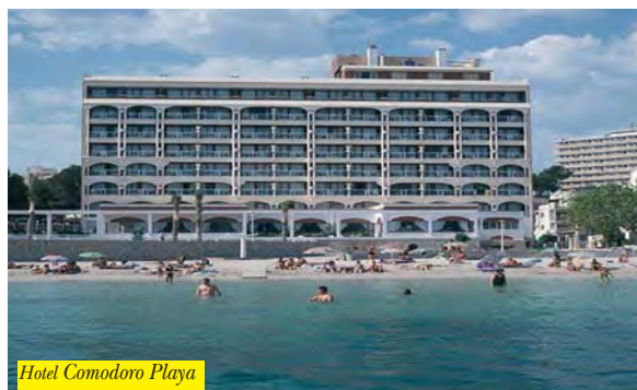
Hotel Comodoro Playa