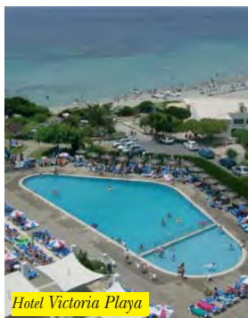
Hotel Victoria Playa