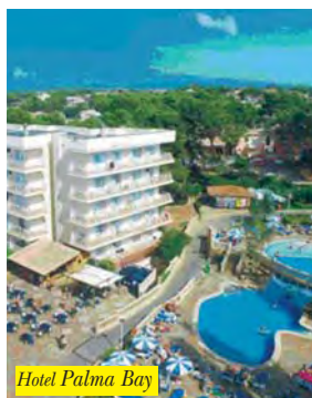
Hotel Palma Bay

La struttura si compone di 4 edifici di 7 piani posta nei pressi della spiaggia di El Arenal da cui dista circa 300 mt. Offre reception 24h, bar, caffetteria, ristorante, sala Tv, ed accesso Internet. Del complesso fanno parte anche un giardino, piscine con zona per bambini e a pagamento sauna, solarium, fitness e campo da tennis. Dispone di 389 camere con telefono, cassetta di sicurezza (a pagamento) e balcone.