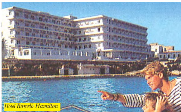
Hotel Barcelò Hamilton