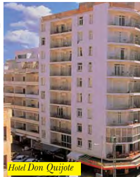
Hotel Don Quijote

L'albergo è posto a 300 mt. dalla spiaggia e 1 km dal centro di Ibiza città. Dispone di reception, bar, sala giochi e TV. Sul tetto si trova la terrazza-solarium con piscina per adulti/bambini e snack sbar. Le camere sono semplici e dotate di servizi privati, telefono e alcune di terrazza.